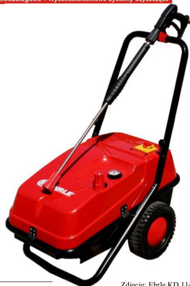
Zdjęcie: Ehrle KD 1140

Agregaty do zadań wymagających wysokiej mocy mycia (ciśnienie max. 250 bar / 1000 l/h), wielogodzinnej ciągłej pracy w trudnych warunkach. Niezawodna, prosta konstrukcja oparta o sprawdzone podzespoły zapewnia wytrzymałość. Doskonale do przemysłu ciężkiego, na wszelkiego typu myjniach, dla firm z dużym taborem pojazdów, w sektorze rolnym i hodowlanym - do mycia dużych powierzchni, usuwania grubych warstw brudu, piaskowania w osłonie wody. Ma mocną pompę korbowodową połączoną elastycznym sprzęgłem z silnikiem niskoobrotowym 1400 RPM chłodzonym wyłącznie powietrzem. Detergent myjący - można go łatwo podłączyć choćby z beczki dzięki systemowi ssącemu wyprowadzonemu poza obudowę. Załączanie - standardową lancą wysokociśnieniową. Rama maszyny Ehrle zespawana została z grubych stalowych rur i blach malowanych proszkowo. Zespół silnik-pompa Ehrle umieszczone jest w poziomie (nisko umieszczony środek ciężkości przydaje dla stabilności urządzenia - EHRLE bardzo trudno przewrócić szarpając ciężkim węzłem).